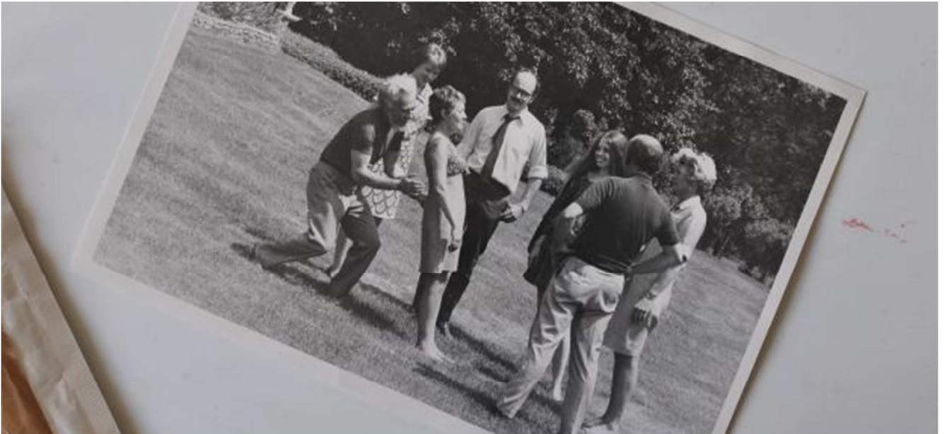
Lúa Coderch, S/T (Un pensament cegat per la il·lusió), 2015